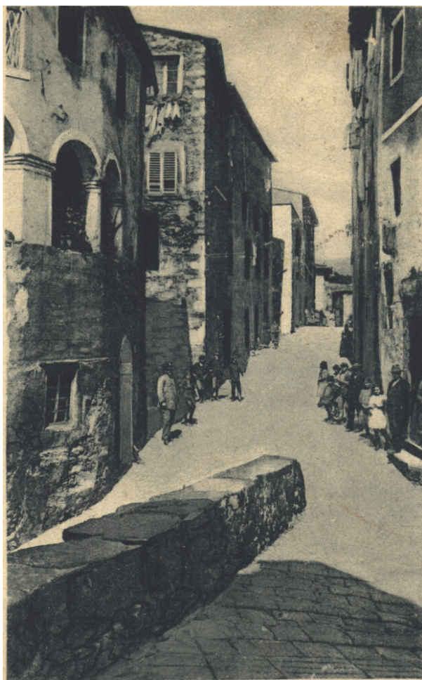
Campiglia Marittima - Via Covour

agricolo e poi come manovale nella costruzione dei pozzi delle miniere aperte dalla Etruscan Mines. Ne ha visti cadere di compagni, portati via dai veleni delle miniere, da una trave che cede, da un incidente che li mutila e li rende storpi e inutili, un peso per le loro famiglie. Con la fine del Granducato aveva visto fare un paese nuovo, l'Italia, aveva assaporato le idee di Mazzini, sperato nella repubblica, in un paese più giusto, come tutti i mazziniani intorno a lui. Ma di giustizia nel paese nuovo ne ha poi vista ben poca, e il Mazzini, tanto amato da lui e dalla sua gente, dimenticato, tradito: ora governano i gabellieri nuovi e i padroni di sempre. Forse quel figliolo un po' di ragione ce l'ha, le cose non possono mica andare avanti così per sempre! Repubblica, socialismo, anarchismo, per lui che è analfabeta son tutte parole vuote, ma le rivendicazioni no, quelle le capisce, e capisce chi sta dalla loro parte, e chi no.