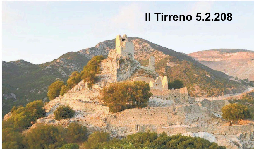
La rocca di San Silvestro a Campiglia

Quindi, secondo il comitato, se nessuno cercherà di opporsi a questo ulteriore scempio paesaggistico, molto probabilmente entro l'anno si vedranno sorgere le pale «a coronamento di una politica - attacca Primi: che dice di volere tutelare il paesaggio e il turismo, ma che di fatto cede troppo spesso a spinte barbariche degne di Attila. Oltre all'idea in sé, quello che scandalizza è che mentre si completava il percorso di variante al piano strutturale e al regolamento urbanistico avvia-