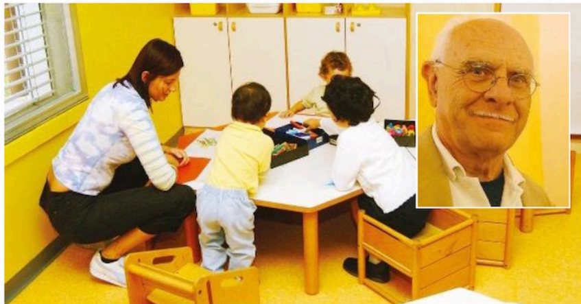
MATERNE Il Comune di fronte al calo delle nascite pensa di riorganizzare le scuole chiudendo a Campiglia

ce cessare di ripetere le solite parole fritte e rifritte su quanto fa il Comune per il centro storico: cinque giorni di Apritiborgo, cinque-sei spettacoli al Teatro dopo due anni di chiusura, il centro Mannelli di fatto inutilizzato, un centro di riabilitazione al posto dell'ospedale, e ambulatori. A parte che mi sembra che il Comune si faccia bello anche con cose che dipendono da lui in minima parte, la Ticciati non si preoccupi: anche noi anziani che non restiamo a Campiglia certo per i 10 giorni di spettacoli su tutto l'anno, siamo destinati a scomparire e finalmente lasciare vuoto il paese vecchio senza più bisogno neanche